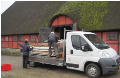
Nedrivningsmaterialerne læsses af ved Beldringe