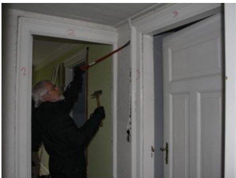
Per arbejder ihærdigt med nedrivning.

Det drejer sig primært om tagsten, hvor vi har imellem 10 og 15.000 stk. på lager fra en lang række forskellige teglværker. Vi har både fals- og vinge-