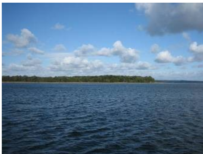
Udsigt fra Præstø havn mod Hollænderskoven

Præstø havn hører til en af Danmarks smukkeste havne—og sådan skal det gerne fortsætte!